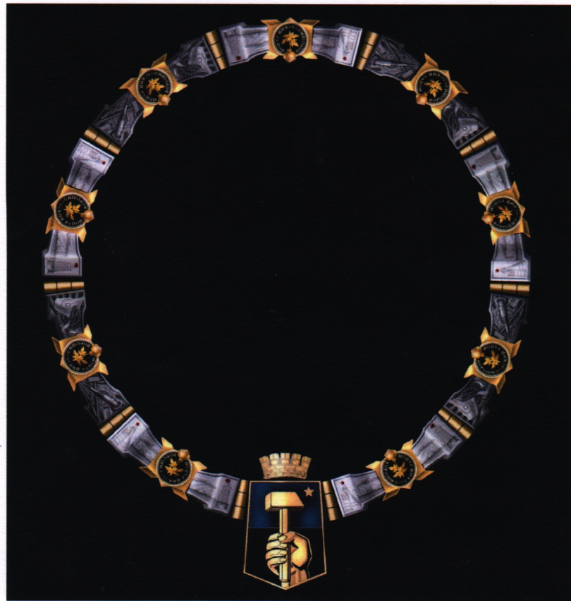
Рисунок должностного знака